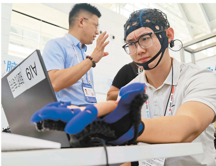
工作人员利用脑机接口技术,进行手部康复训练展示。