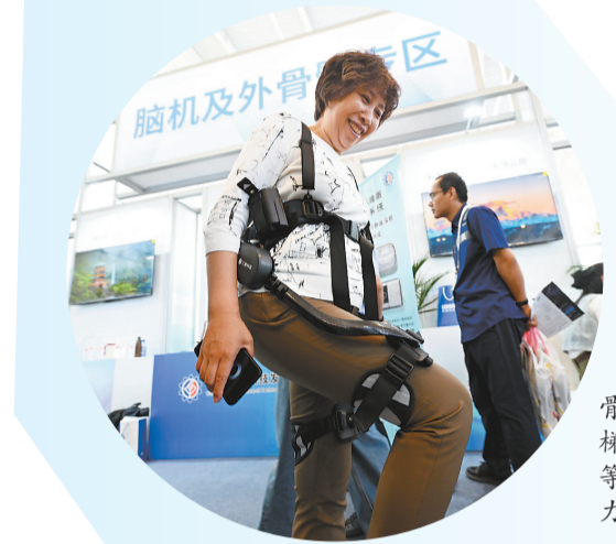
“随行”外骨骼对上下楼梯、走路、爬山等动作起到助力作用。