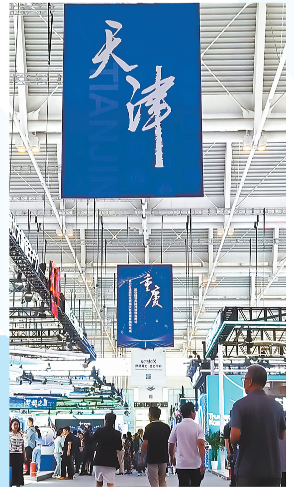
N25 综合馆集中呈现主办城市风采、区域协同成果和国际开放合作成果。