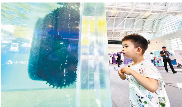
智能泳池清洁机器人。