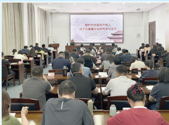
宝坻区委党校科级干部任职培训班围绕了凡善廉文化进行授课,教育引导党员干部加强道德修养、涵养廉洁操守。