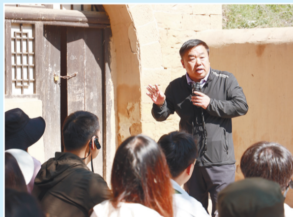
市教育两委组织师生在延安梁家河等地开展现场教学,教育引导广大师生传承红色基因、赓续红色血脉。