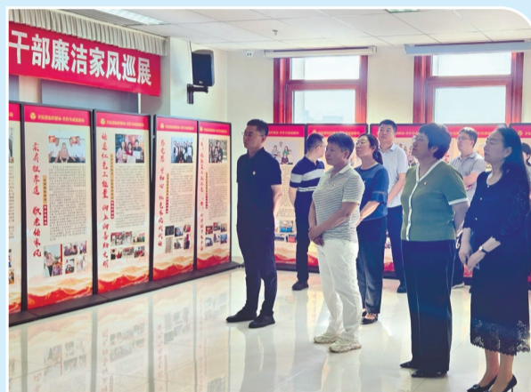
武清区纪委监委组织党员干部参观“通武廊党员干部廉洁家风巡展”,推动清廉家风浸润人心。