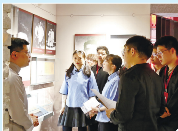
党员干部群众以沉浸式互动演绎方式参观觉悟社纪念馆,追寻红色足迹、感悟觉悟精神。