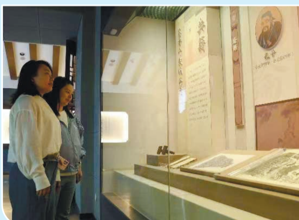
市纪委监委驻市文化和旅游局纪检监察组联合天津博物馆打造廉洁文物主题展,切实增强廉洁教育的感染力。