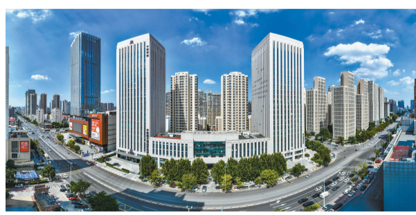
中铁建大厦(左)。

回忆盘活过程,南开区相关负责人告诉记者:“得知中国铁建要布局天津轨道交通PPP(政府和社会资本合作项目),我们第一时间上门表达诚意:中铁建需要二级总部,